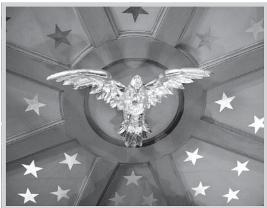
Symbol Ducha św. na baldachimie ambony w kościele pw. św. Mikołaja w Jedlni.

Św. Paweł w Liście do Rzymian naucza: „Gdy nie umiemy się modlić tak, jak trzeba, sam Duch przyczynia się za nami w błaganiach, których nie można wyrazić słowami. Ten zaś, który przenika serca, zna zamiar Ducha, wie, że przyczynia się za świętymi zgodnie z wolą Bożą” (Rz 8, 26–27). Duch Święty jest zawsze obecny w naszej modlitwie. Bez jego pomocy nie jesteśmy w stanie się