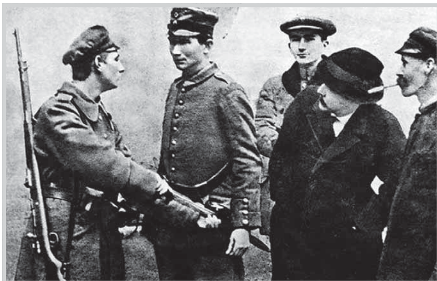
Rozbrajanie Niemców w Warszawie.

Przełomowym wydarzeniem dla przyszłości Legionów Piłsudskiego i dla niego samego okazał się kryzys przysięgowy. W lipcu 1917 r. Brygadier odmówił złożenia przysięgi na wierność cesarzom Niemiec i Austro-Węgier. W konsekwencji został osadzony w twierdzy magdeburgskiej a jego legionieści w obozach: Beniaminowie, Szczypiornie i Łomży. Legionieści znajdujący się w Szczypiornie koło Kalisza dla urozmaicenia obozowego